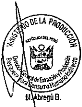
GLADYS TRIVEÑO CHAN JAN Ministra de la Producción