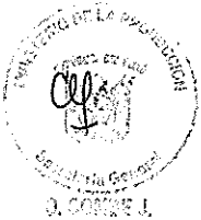
GLADYS TRIVEÑO CHAN JAN Ministra de la Producción