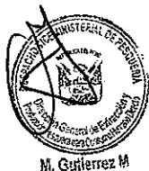
PIERO EDUARDO GHEZZI SOLÍS Ministro de la Producción