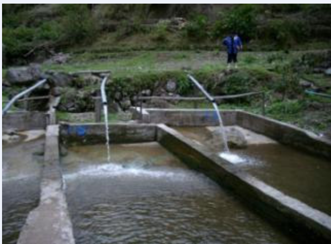
Piscigranja La Pradera