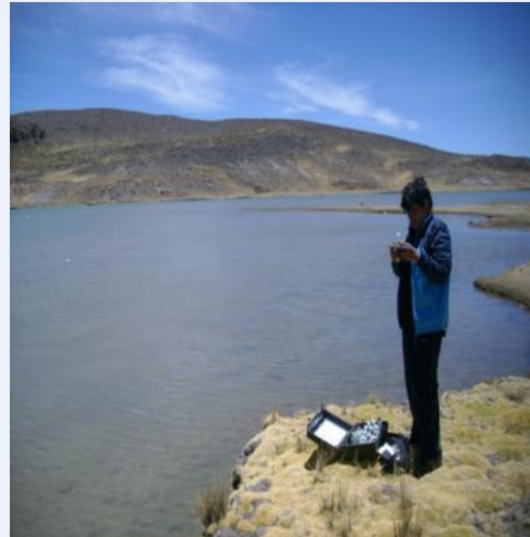
Evaluación Laguna de Cceccaycocha-Acoria