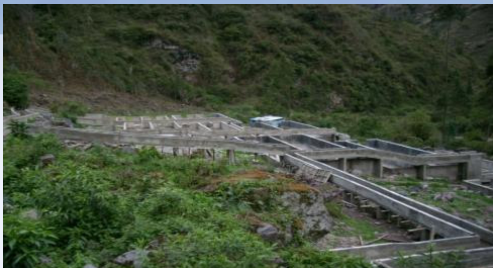
Piscigranja de San Isidro de Acobamba-Tayacaja