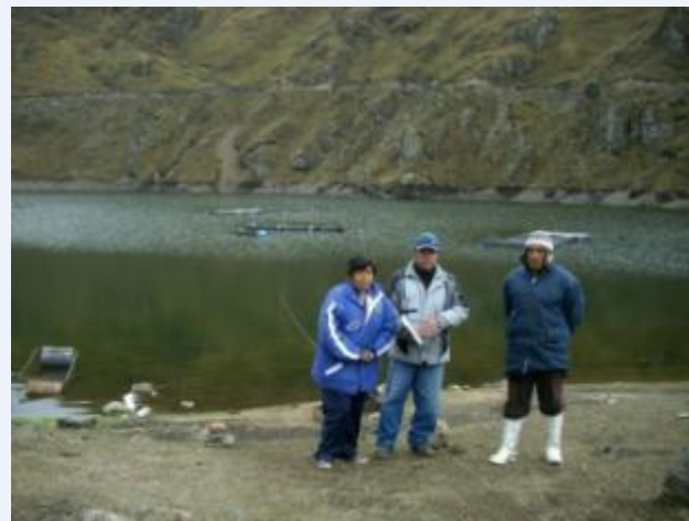
Laguna de Cochapata, San Marco de Rochac