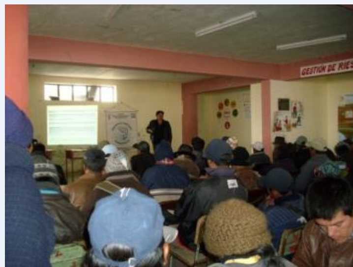
En la Comunidad de Santa Inés-Huaytara