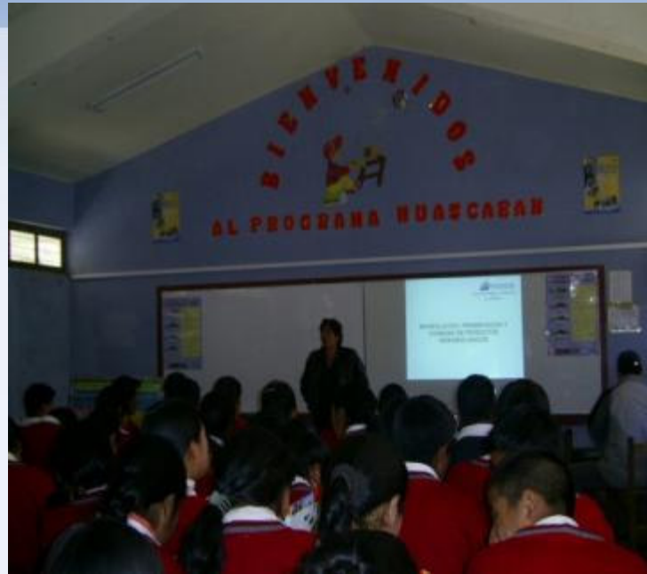
Capacitación a estudiantes de 5to Secundaria-Colegio de Castrovirreyna

8.- El Proyecto Recuperación de la capacidad productiva en la estación pesquera de Pultoq grande Santa Ana no fue aprobado